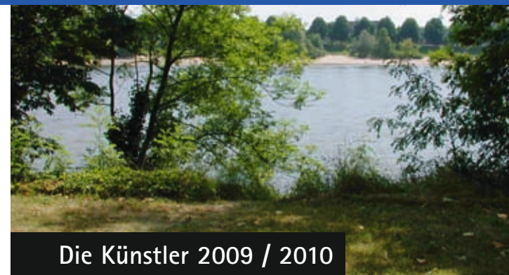
Die Künstler 2009 / 2010