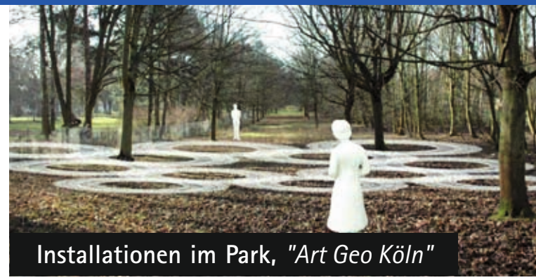
Installationen im Park, "Art Geo Köln"

Im Schlosspark ist der Wandel stets gegenwärtig, aber auch das Beständige hat seinen Platz: Zu Pfingsten 2009 wird zum 8. Mal in Folge eine neue Werkschau zum Thema Rheinblicke Einblicke eröffnet, zum 5. Mal wird der begehrte Kunstpreis Schlosspark verliehen.