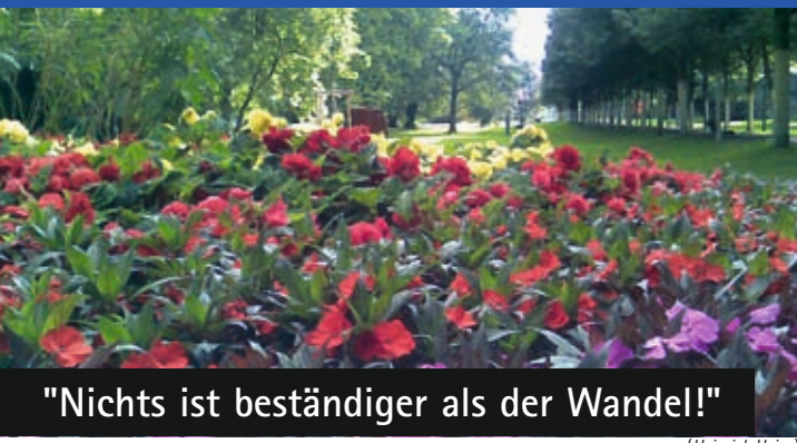
"Nichts ist beständiger als der Wandel!"